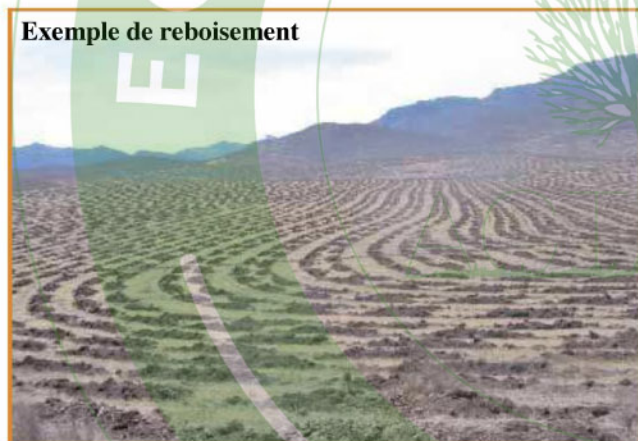
Exemple de reboisement

Terrain juste travaillé avec charrue spéciale